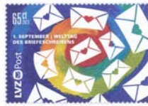
Postkarte „Tag des Briefeschreibens“, 65 C., Ausgabe 1.9.2023, Verkaufspreis 0,65 € Abb. Rs. links, darüber Vs. (Ausschnitt)