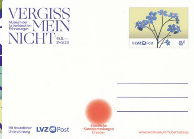
Postkarte „VERGISS/MEIN/NICHT“ 65 Cent, Ausgabe 14.05.2023, Verkaufspreis 2,50 € Abb. Vorderseite oben, Rs. links.