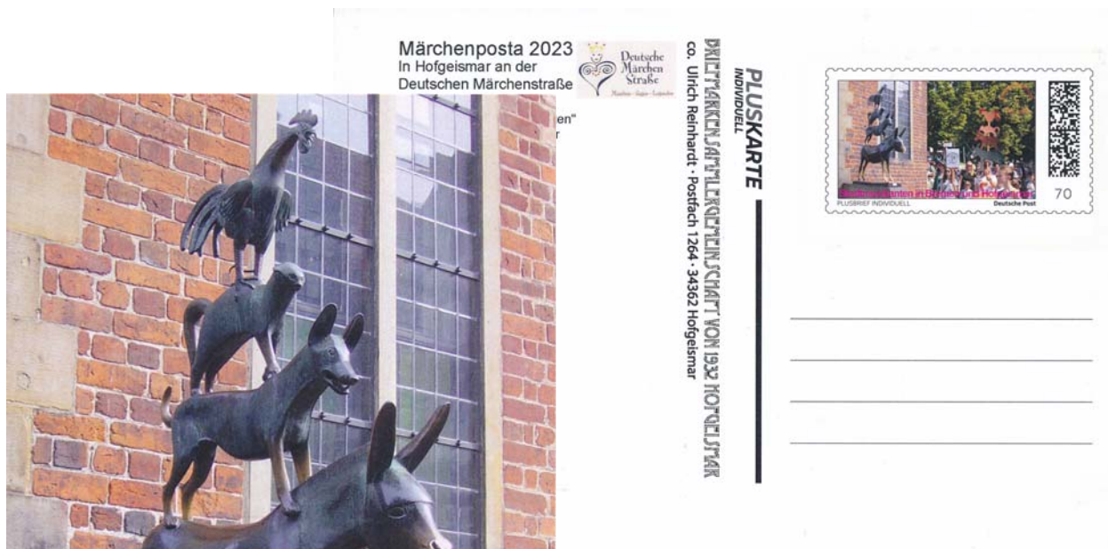
Skulptur der Stadtmusikanten in Bremen an der Deutschen Märchenstraße von Gerhard Marcks, aufgestellt 1953