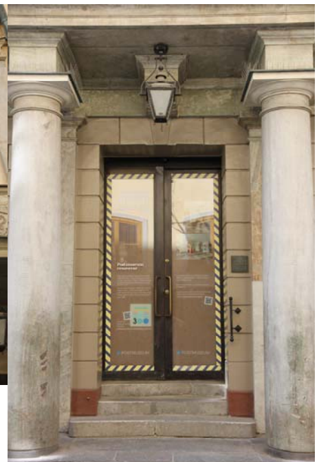
Abb. Postmuseum, Vorderseite und Portal.