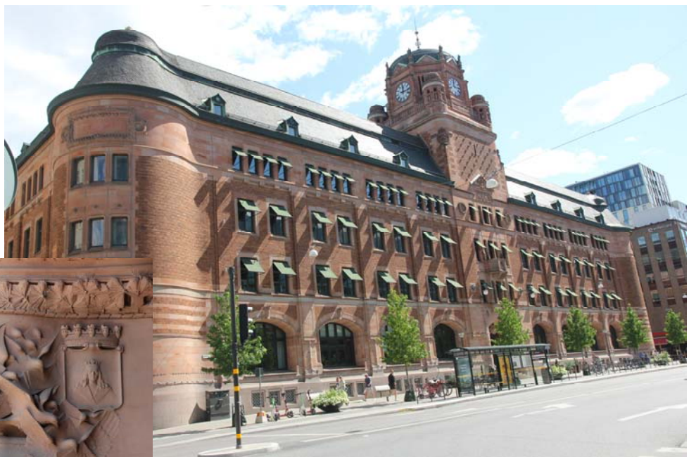
Linke Abb.: Detail am Hauptportal.

Nicht so schlimm, es gibt doch noch ein Postmuseum in der Altstadt Stockholms. Die Idee gut – aber dort war Baustelle und somit kein Einlaß. Werde wohl wiederkommen müssen, um die Exponate sichten zu können. (Abb. nächste Seite oben.) In dem Gebäude aus dem 17. Jahrhundert ist seit 1906 das Museum. Neueröffnung soll laut Webseite nach Jahren der Renovierung am 19. Oktober sein.